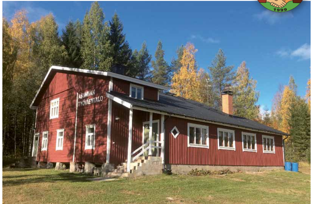
Asunnan Työväentalo Keuruulla on remontoitu vuosien saatossa upeaan kuntoon.

Seuran päässä vuoden ikään niin hankittiin ensimmäinen retkeilykohde seuran hallintaan. Siis ostimme Asunnan Työväentalon Keuruulta ja nyt seuramme oli todella velkainen, sekä todella huonokuntoisen Työväentalon omistaja. Nyt piti pistää hihat heilumaan, että saataisiin rahoitusta talon kunnostukseen ja lainan lyhennyksiin. Kuvaan tulivat monet perinteiset rahan hommauskonstit. Niitä olivat kirpputorit, myyjäiset, huutokaupat, huutokauppojen kahviot, talkootyöt, pullonkeräys, lahjoitukset, arpajaiset jne... Yhtenä merkittävänä tulon lähteenä oli Kesä-kirpputori Asunnan Työväentalolla, joka tuotti todella hyvin. Hienosti onnistui rahanhankinta talkoilla ja velka tuli maksettua ennätysajassa. Samalla tehtiin myös kesäisin suuria korjaustyöt Työväentalolla talkoilla. Asunnan kesätalkoista on sitten tullut jokavuotinen ta-