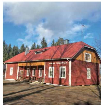
Viralan työväentalo.