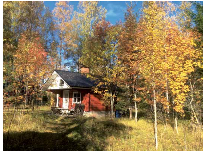
Asunnan saunassa kelpaa kylpijään nautiskella.