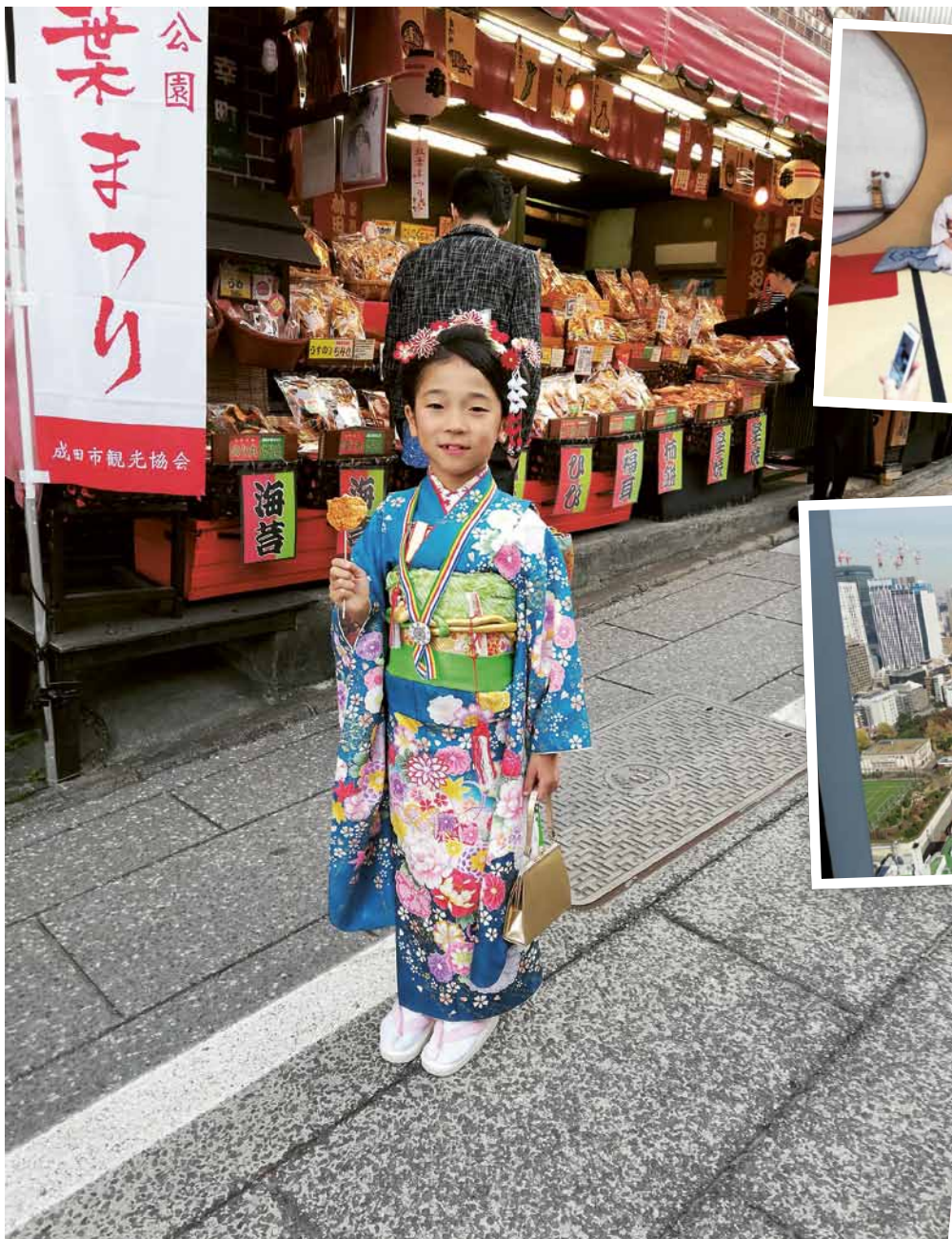
Japanin pikkuneiti parhaimmillaan Naritan kadulla.