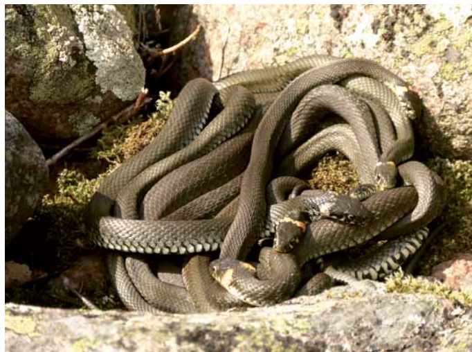
Kuvaushetkellä käärmettä oli vain seitsemän, parhaimmillaan kuusitoista.