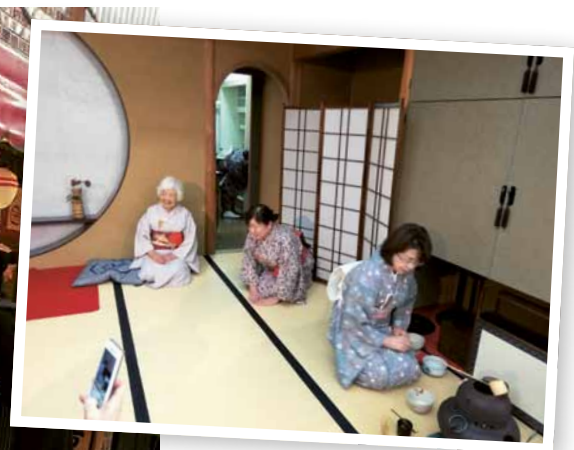
Ikivanhaa kulttuuria läheltä nähtynä.