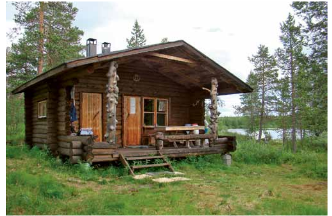
Käkkälön kämpppä kalaisan Käkkälöjoen mutkassa.