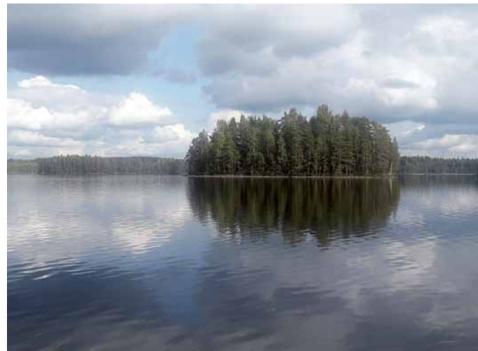
Soutaen järviä – saaria – salmia ...

Tapaamme klo 10 Helsingin rautatieaseman pääoven edessä, josta lähdemme Anne Linderoosin johdolla tutustumaan keskusta-alueen puistoihin. Omat