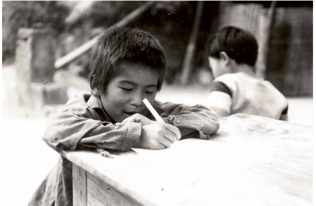
Bunima piirtää. “Pen ja peipper” olivat nepalilaislapsille kaikkein mieluisimpia. Heidän silmänsä ja suunsa nauroi, kun ojentuneeseen käteen sai lisää paperia. Tämä kylä voi hyvin, paremmin kuin monet muut, mutta koulua ei ollut, koulua piti kyllä kiertävä lääkäri.

Paikalle pyrähti lapsiparvi. He kantoivat keppien nokassa saamiinsa papereille piirrettyä Buddhan kuvaa. Lapset kumartuivat ot-