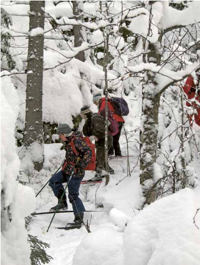
Maasto oli ihanteellista rämpimiseen.

Kaunis, sipoolainen talvinen metsä sulki akat syleilynsä tammi-kuun viimeisenä viikonloppuna 26.-27.1. Teltassa tarkeni, kun oli hyvät varusteet, pakkasta yöllä 20°. Tulenteko oli helppoa ja oikeaoppista, kun kuivia koivuhalvoja oli tarjolla. Metsän eloa tutkailtiin hiihtäen ja lumikenkäillen.