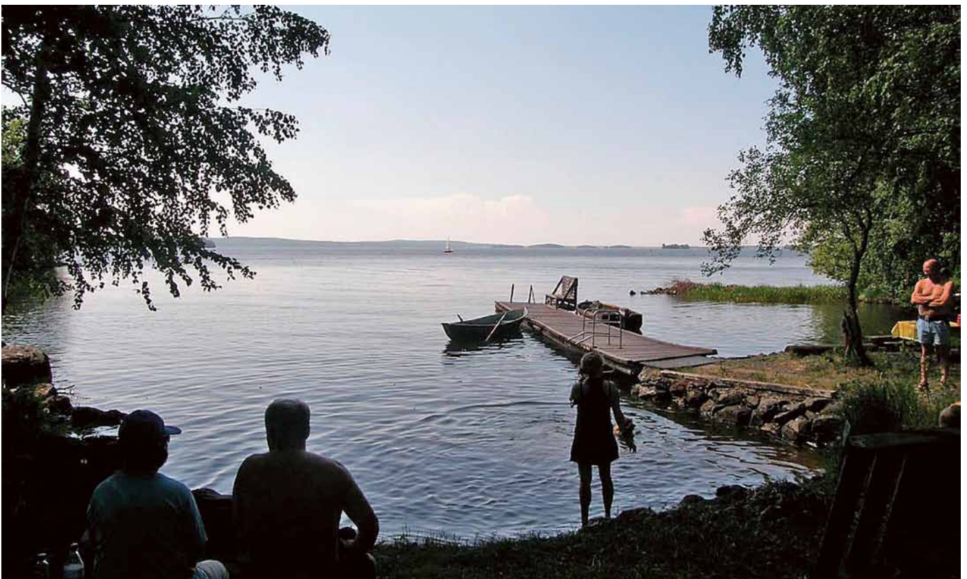
Kesäpäivän vietto Vanajaniemen kämpän rannassa.

Usean vuoden ajan seura teki retkiään lähiseuduilla ja kaipasi itselleen omaa tukikohtaa. Toive toteutui monen vuoden kovan talkootyön jälkeen, kun omin voimin rakennettu hirsikämpä valmistui vuonna 1987 Padasjoelle Hakostenjärven rantaan, Hämeenlinnan kaupungin maalle. Jälkikäteen työ tuntuu uskomattomalta. Pieni joukko purki Hämeenlinnasta van-