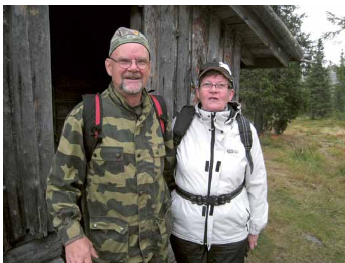
Lesket Porokämpällä Sammaltunturin rinteellä syksyllä 2013.